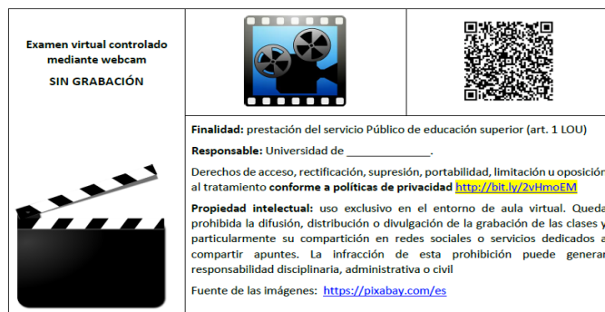
Información gráfica para control remoto