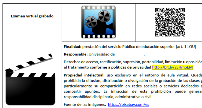
Información gráfica para grabación